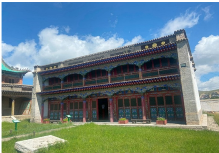
Рис. 1. Западный Сэмчэн-дуган, 2022 г.