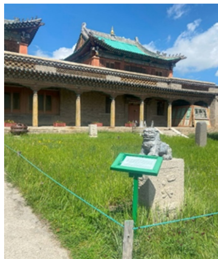
Рис. 2. Лавран-дуган

Деятельность предыдущих монахов возобновлена молодым поколением лам, которыми были начаты службы в храме Тугсбаяалант, построенном рядом с музеем Зая-гэгэна в 1990-х гг. В настоящее время в этом храме служат около 30 лам. Эмчи-ламы монастыря летом занимаются сбором лекарственных растений, тем самым продолжая традиции монгольской ветви индо-тибетской медицины, заложенные первыми эмчи-ламами. В 2004 г. в Улан-Баторе, недалеко от монастыря Гандантегченлин, был открыт его филиал – храм Гушиг, в котором насчитыва-